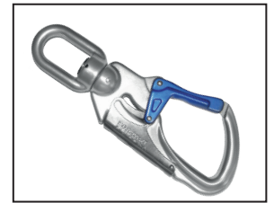
IKV 21 (EN 362:2004-T) mit Fallanzeiger