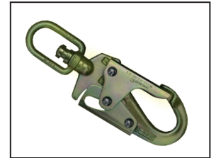
IKV 33 (ANSI Z.359.1-2007; CSA Z259.12-2011) mit Fallanzeiger